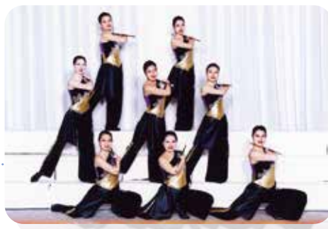
バントワリング部