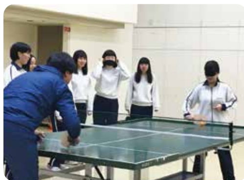
サウンドテーブルテニスの体験