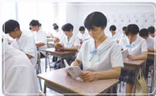
朝読書で一日が始まります