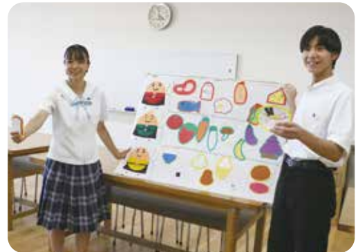
こども文化演習の発表