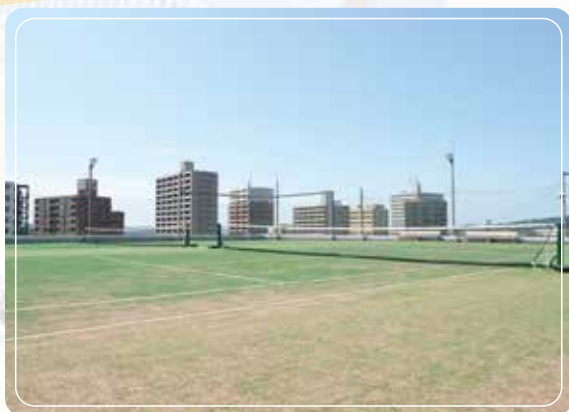
屋上テニスコート