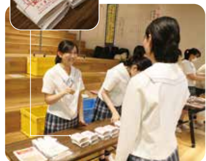
和高祭での販売実習