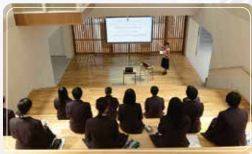
イベントホールでの授業